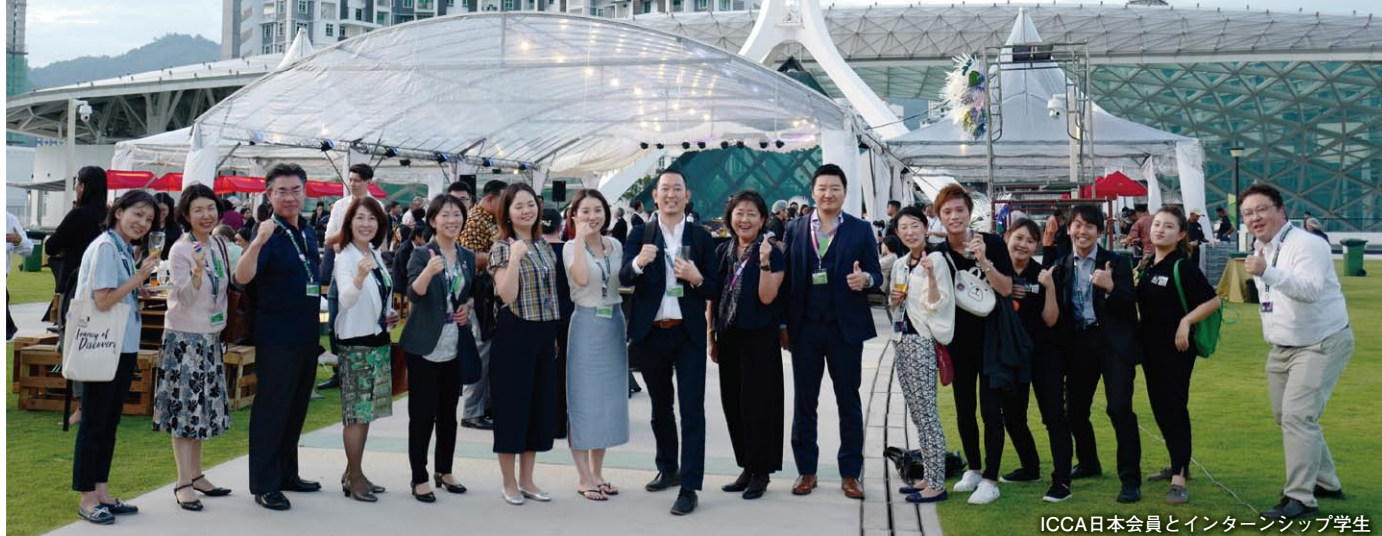
ICCA日本会員とインターンシップ学生

国際会議協会 (ICCA) には国際会議ビジネスにかかわる約1,100団体が加盟していますが、そのうちアジアパシフィック部会には現在16か国・291団体が所属しており、ICCAの中でも最大の部会となっています。メンバー間の交流を深め、団結を強めていきたいという提案を受けて、初回の「ICCAアジアパシフィック・サミット」をマレーシア・ペナンで開催しました。